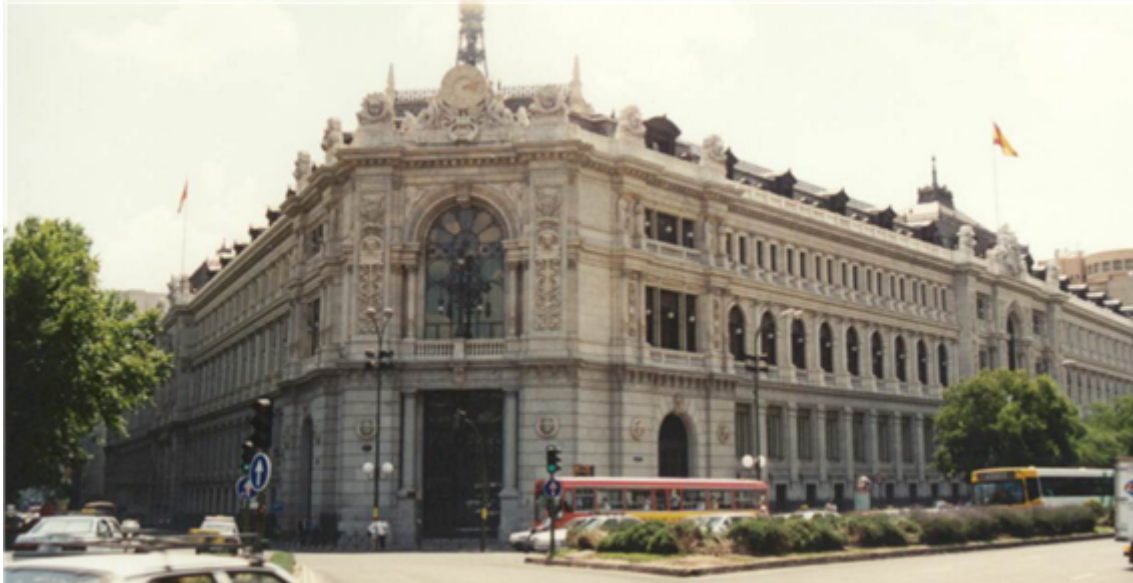
Fig. 48: Banco de España

Tres marcas españolas están entre las cien más valiosas del mundo: Movistar, Grupo Santander y Inditex.