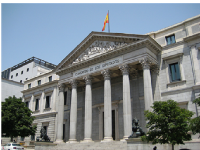
Fig. 6: Congreso de los Diputados.