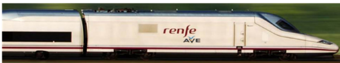
Fig. 46: AVE, tren de alta velocidad española

Puertos más importantes: Algeciras, Barcelona, Las Palmas, Bilbao, Valencia y Vigo.