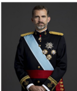
Fig. 4: Felipe VI, Rey de España

El Rey de España es el Jefe del Estado y la Corona es el símbolo de la unidad de España. Tiene la máxima representación del Estado y modera el funcionamiento de las instituciones. Además, entre otras funciones, sanciona y promulga las leyes, nombra a los miembros del Gobierno, a propuesta de su presidente, y tiene el mando supremo de las Fuerzas Armadas de España.