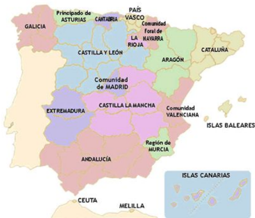
Fig. 16: Mapa político de las comunidades autónomas de España.

En el mapa político de España, se puede observar la división de España en comunidades y ciudades autónomas.