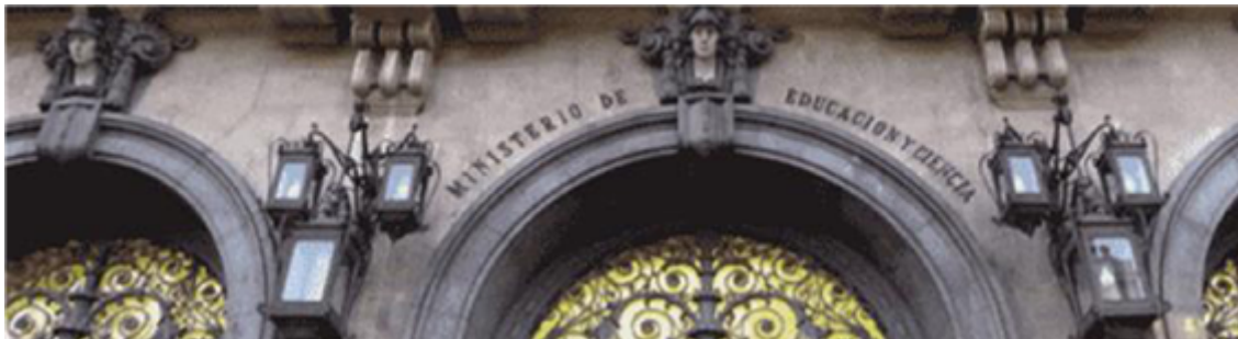
Fig. 33: Ministerio de Educación y Formación Profesional, calle Alcalá, Madrid

La educación es un derecho de los ciudadanos; es obligatoria y gratuita (excepto libros y materiales educativos) desde los 6 hasta los 16 años, lo que se llama educación básica española .