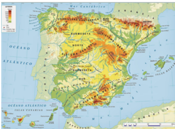
Fig. 14: Mapa físico de España.