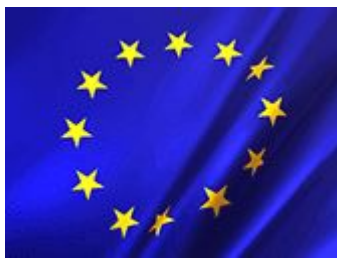
Fig. 5: Bandera de la Unión Europea.

La bandera de la Unión Europea es azul con 12 estrellas amarillas.