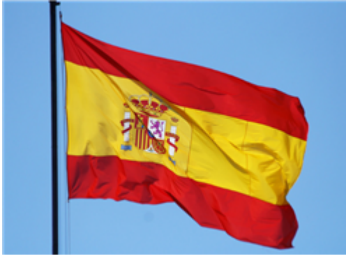
Fig. 2: Bandera de España

En la Constitución se indica que el castellano es la lengua oficial de España . Todos los españoles tienen el derecho y el deber de conocerla. Las demás lenguas españolas serán también oficiales en las comunidades autónomas donde se usen, de acuerdo con sus respectivos estatutos. En España la enseñanza de las lenguas cooficiales es competencia de las comunidades autónomas.