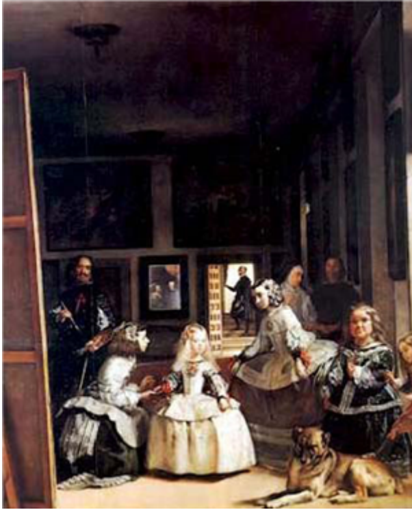
Fig. 19: Las meninas , de Velázquez.

España tiene un rico patrimonio. La UNESCO ha reconocido 47 bienes españoles como Patrimonio de la Humanidad, colocando a España en el tercer país con más bienes reconocidos, por detrás de Italia (54) y China (53).