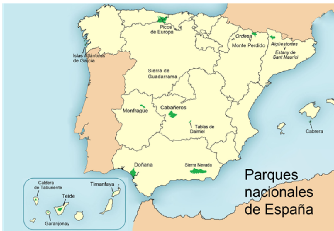
Fig. 15: Parques nacionales de España.

España fue uno de los primeros países de Europa en comenzar a proteger la naturaleza; la primera Ley de Parques Nacionales se aprobó en 1916. Tiene 15 parques nacionales; su gestión y protección se hace a través de la Red de Parques Nacionales.