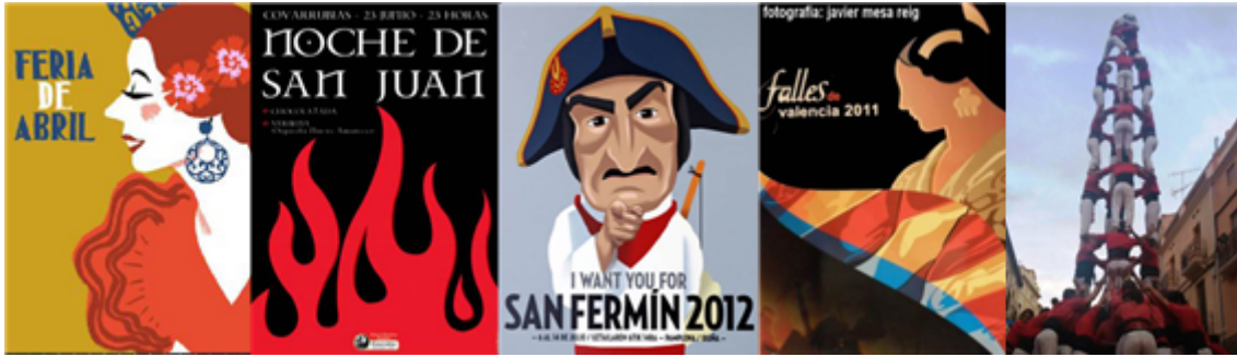
Fig. 25: carteles de fiestas tradicionales de España de repercusión internacional