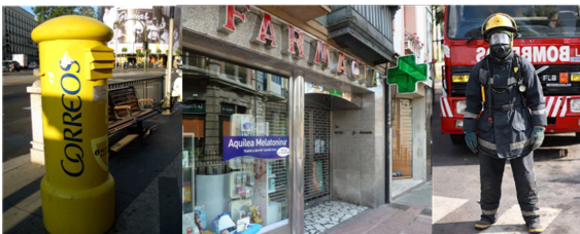
Fig. 41: Imágenes de un buzón de Correos, de una farmacia y de un bombero.

quioscos: lugar en el que se venden periódicos, revistas, coleccionables, etc.